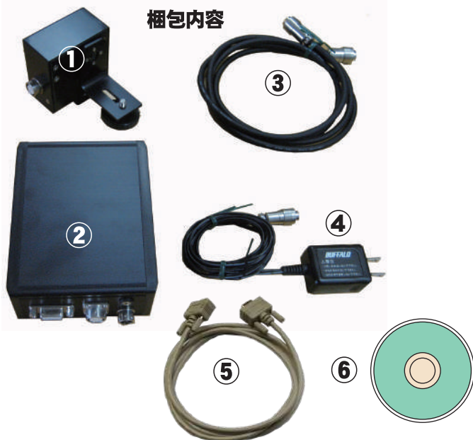
ケーブルコネクタ