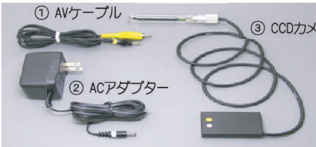
④ 取扱説明書、保証書(本紙)