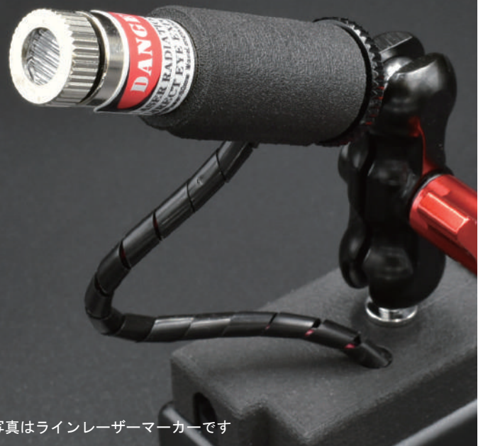
※写真はラインレーザーマーカです

※この製品は建設現場等での使用を想定して作られております。 その他の用途に使用する場合はご相談ください。